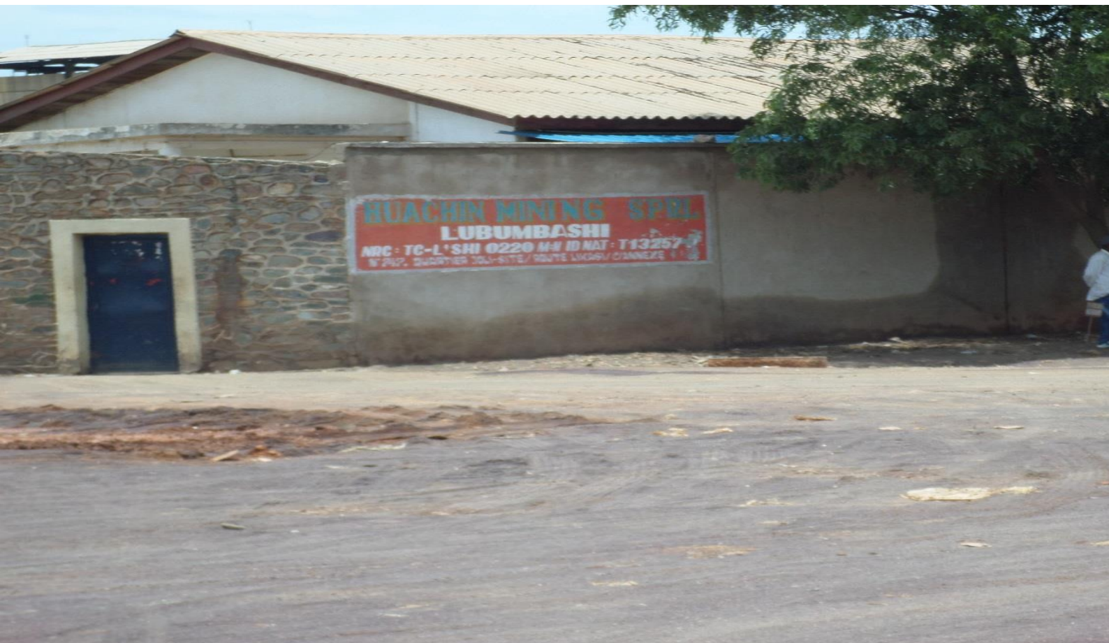
Les bureaux de HUACHIN à Lubumbashi (PREMICONGO)

Les communautés locales vivant dans la chefferie de KONI à Kisanfu n'ont quant à elles tiré aucun avantage de l'implantation de MKM dans la région ; d'une part, les habitants n'y ont pas trouvé d'emplois et d'autre part, ils assistent impuissants à la destruction de leur espace de vie avec la pollution de la Dikanga et la disparition progressive de la forêt de Myunga. En réalité, la communauté locale a été d'avantage appauvrie à cause des impacts négatifs dus à l'installation de cette entreprise dans la contrée.