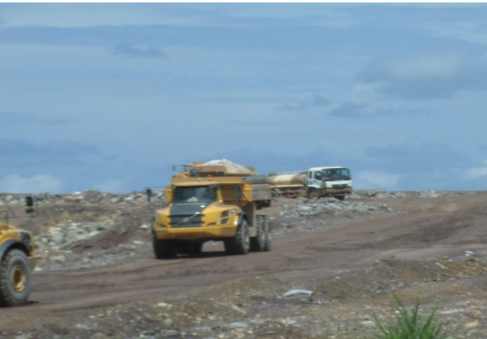
La mine à ciel ouvert de MKM à Kisanfu

membres les deux sociétés mères, MKM et HUACHIN fonctionnent en « hors la loi ». Ces dysfonctionnements s'expliquent dans les deux cas par l'incapacité de l'administration ayant en charge les mines et celle ayant en charge le travail et la sécurité sociale à faire respecter les normes en vigueur. Nos recherches ont en effet démontrées que non seulement les services compétents ferment les yeux, mais en plus, ils participent aussi activement à ces violations. En conséquence, l'effervescence des investisseurs chinois dans le secteur minier au Katanga n'a pas d'impact positif pour les communautés locales. Bien au contraire, ces communautés qui éprouvaient déjà des difficultés pour vivre décemment avant l'arrivée de ces entreprises se retrouvent plus pauvres aujourd'hui à cause de la disparition de leurs moyens de subsistances.