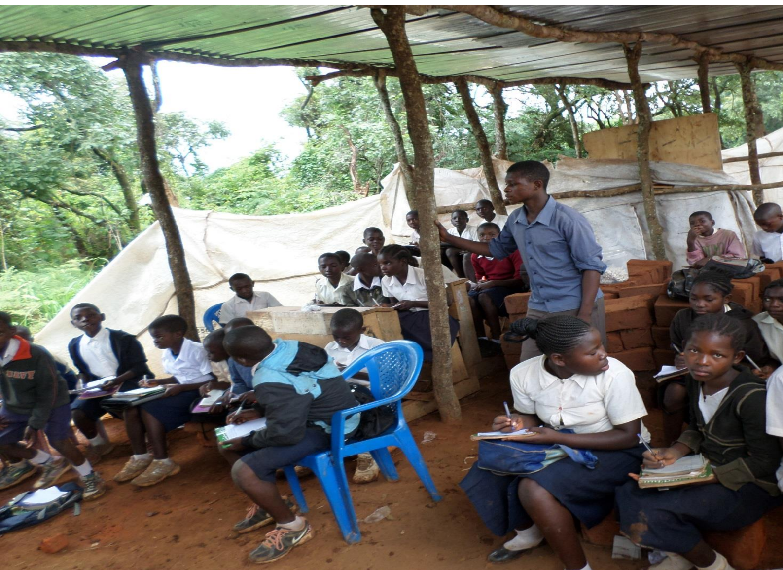
L'école de Kisanfu à proximité du site d'exploitation de MKM