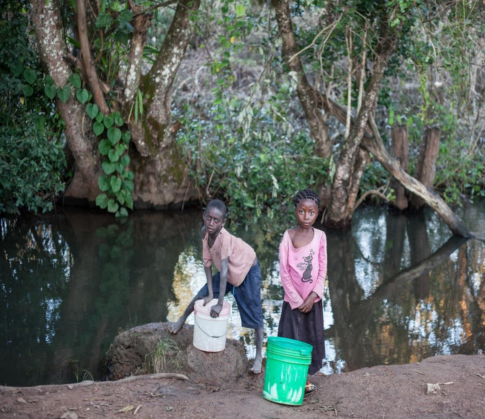
Bien que polluée, la rivière Dikanga reste l'unique source d'approvisionnement en eau pour plusieurs villages