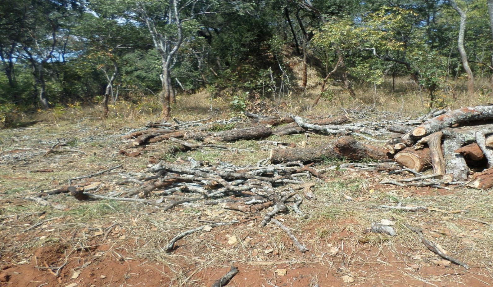
Figure 1: La forêt de Myunga disparaît progressivement sous les coups de haches des travailleurs de MKM

Pire encore, MKM s'est rendu coupable de fausses déclarations à l'initiative pour la transparence dans les industries extractives (ITIE) sur des soi-disant paiements sociaux d'une valeur de 151.000 USD. ; Assistance médicale 1000 USD, construction de latrines 10.000USD, construction Centre de santé 140.000 USD et assistance sportive 300 USD (Confère rapport ITIE 2013). La société prétend avoir effectué ces paiements en faveur des communautés locales de Kalumbwe. Hors, nous l'expliquons plus haut, Kalumbwe n'est pas un village mais un camp de fortune bâti par des travailleurs de MKM. Ce camp n'abrite aucune famille appartenant à la communauté locale.