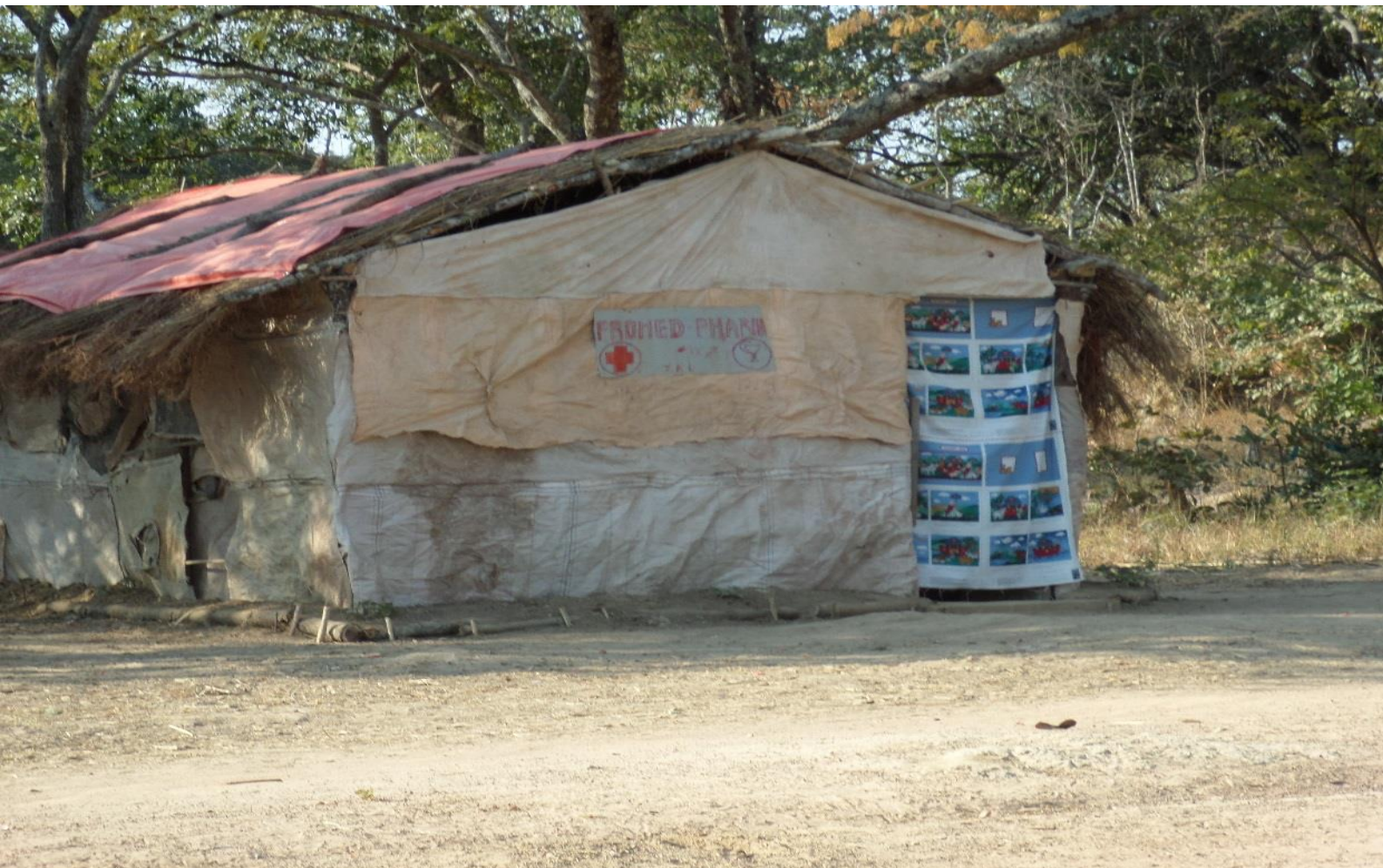
Le « Centre de Santé » des travailleurs de HUACHIN à Mabende

Ce qui constitue une entorse à la législation minière (code minier, articles 69 point f. ; règlement minier, article 13, annexe 8, etc.). La société développe son projet sans se soucier de mettre en œuvre le PGEP et des PDD autour de ses différents sites à cause du laxisme de la DPEM.