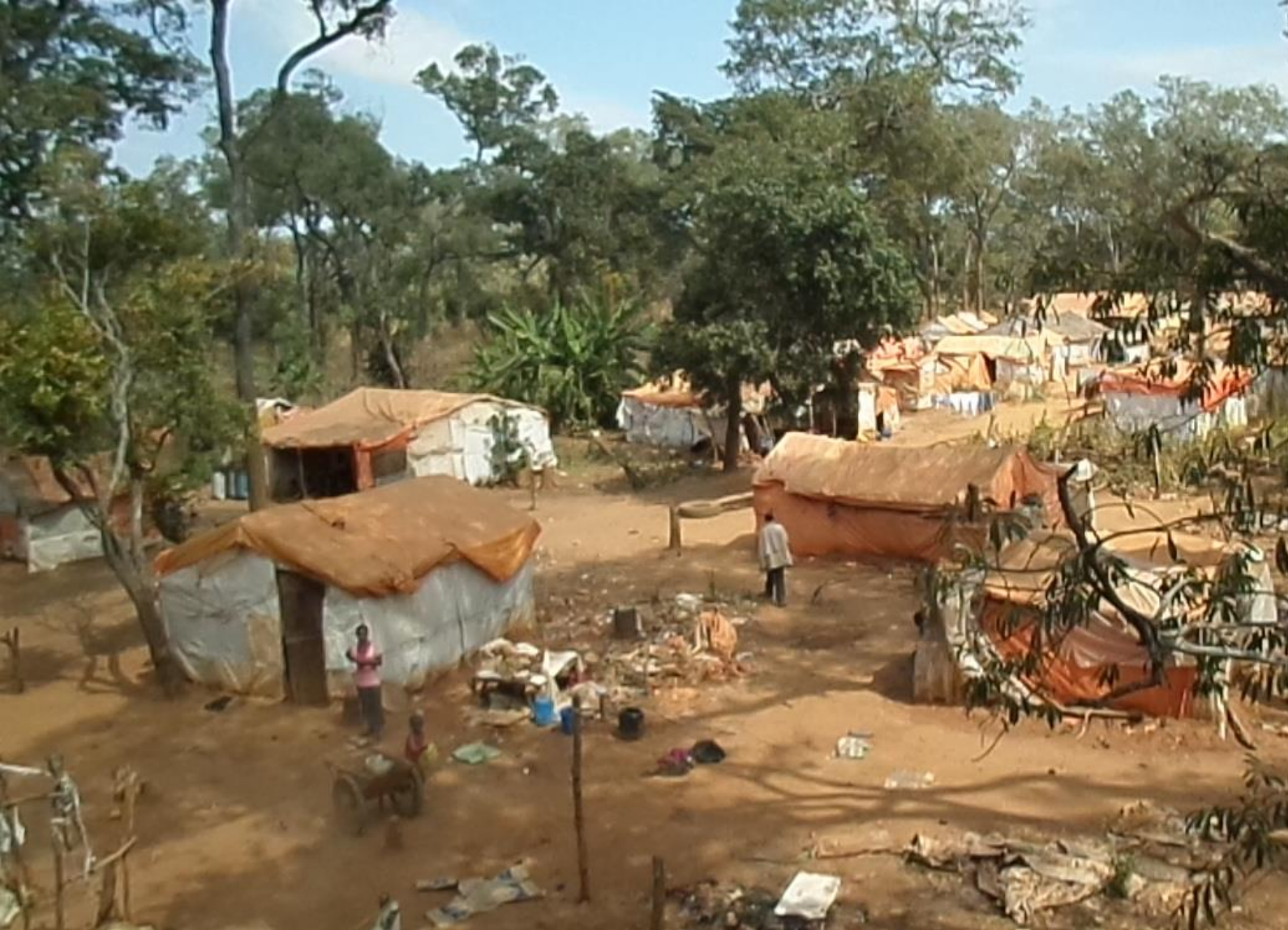
Le « camp des travailleurs » de MKM à Kalumbwe