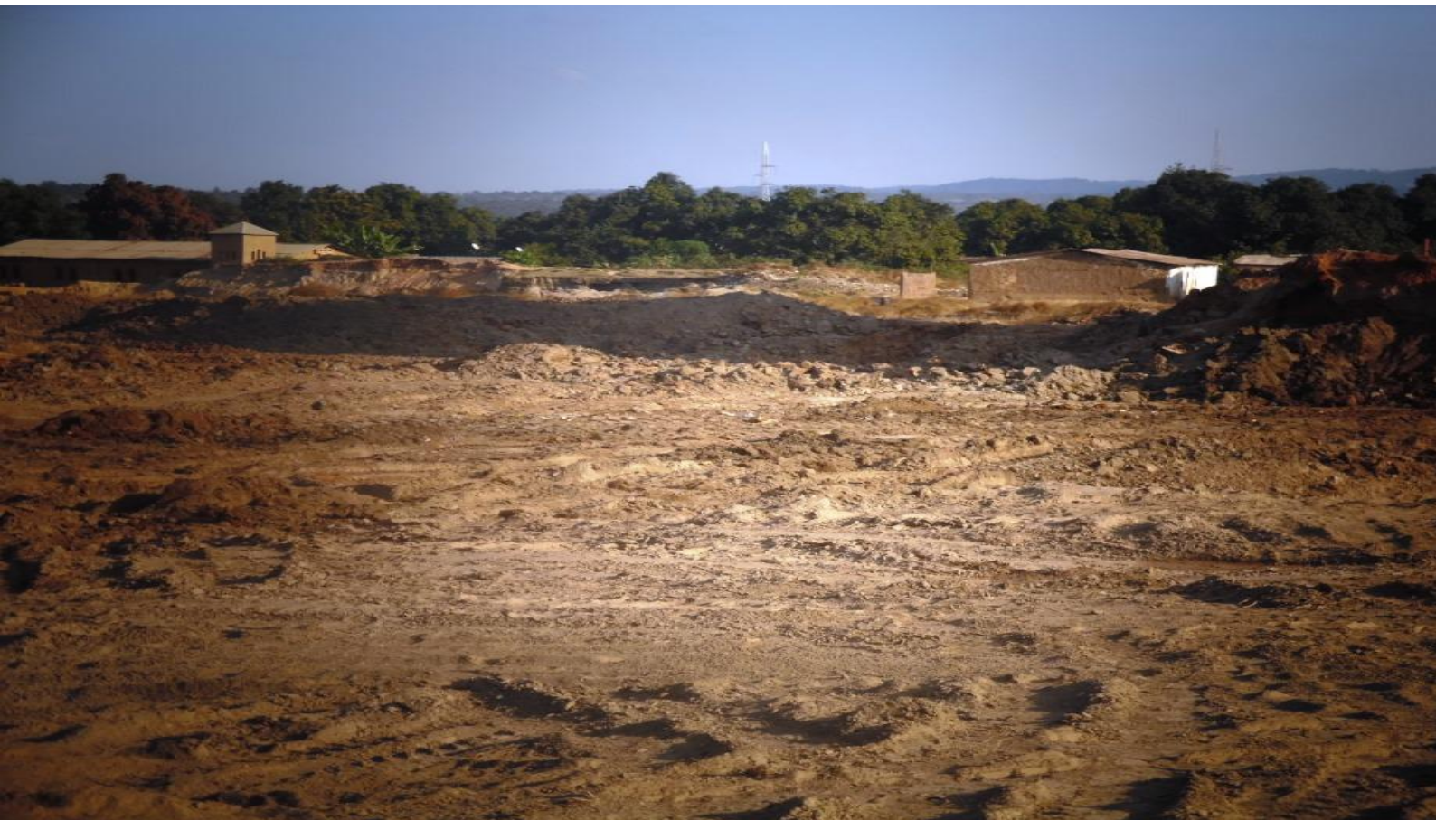
A Likasi, HUACHIN s'approvisionne aussi sur des reblais situés en plein quartier résidentiels Ici, dans la commune de Panda

Actuellement, HUACHIN qui ne peut plus s'approvisionner à Shमितumba multiplie des sources d'approvisionnement dans divers carrières, terrils de rejets, et mines artisanales. Les creuseurs vont aussi livrer leurs produits directement aux entrepôts de la société, à Lubumbashi et Likasi.