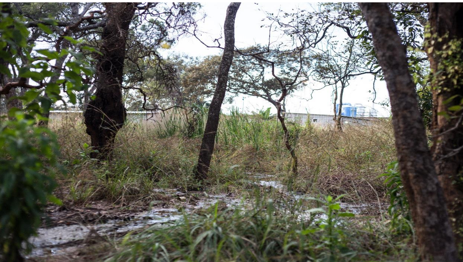
Les effluents de l'usine de MKM sont déversés sans canalisation dans la forêt

MKM ne respecte pas non plus la législation minière (code minier et règlement minier) notamment en ce qui concerne ; Les dispositions sur l'information et la consultation des communautés locales lors de l'élaboration et de la mise en œuvre des études environnementales (études d'impacts environnementale, Plan de gestion environnementale du projet, Plan de développement durable en faveur des communautés riveraines). Conformément à l'article 69 code minier.